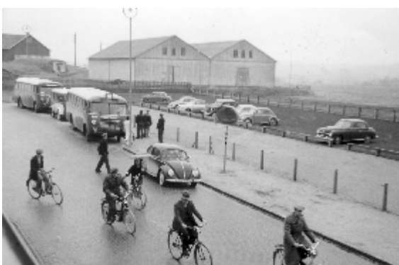
Skiftbyte vid Kungsfors i bakgrunden några bomullsmaoasin

Skene var en del av Örby socken och ligger i Viskadalen. Samhället blev municipalsamhälle 1941 och avskildes från Örby kommun och blev köping fr.o.m. den 1 januari 1952. Möjligheterna till egen utveckling blev därigenom avsevärt bättre. Skene var ett