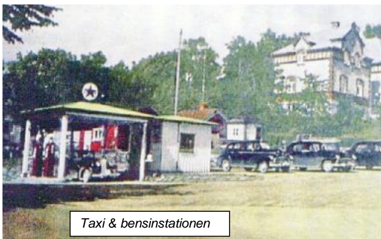
Taxi & bensinstationen

Bensin kunde man få fr.o.m. hösten 1945 mot kupong och efter behovsprövning. Men det var värre med däcken. Till en början kunde man utan behovsprövning få regummerade s.k. traktordäck, men de var väldigt dåliga och punkteringarna var legio. Från och med hösten 1946 kunde vi få riktiga däck från Firestones fabrik i Viskafors – givetvis efter ansökan och behovsprövning.